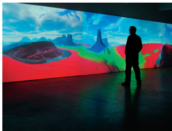
RGB Land ", 2006, Installation vidéo, Logiciel et musique : Eric Wenger