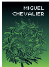
Miguel Chevalier, Monografik Editions, 2008