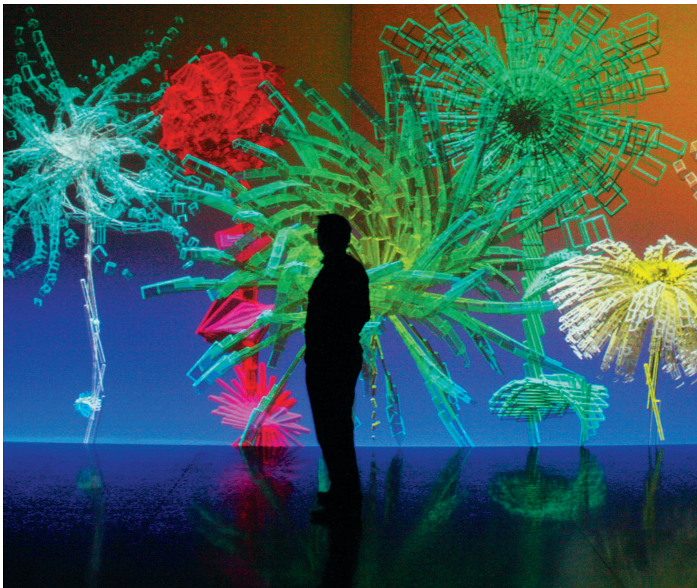
Fractal Flowers , 2008, Installation interactive, Logiciel : Cyrille Henry