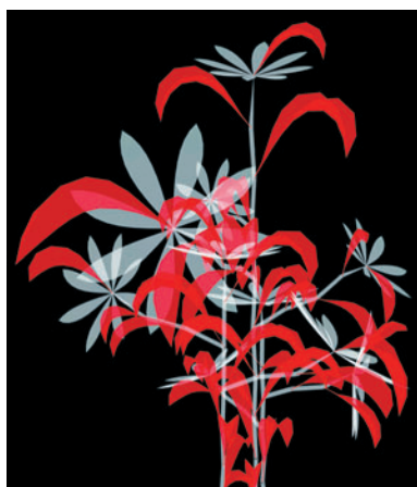
Sur-Nature , Graine n.16, 2004 Installation interactive, Logiciel : Music2eye

"Fractal Flowers" sur Le parvis de la Mairie du 4 e arrondissement de Paris et sur Les murs de L'église Saint-Joseph d'Enghien-Les-Bains jusqu'au 11 janvier 2009.