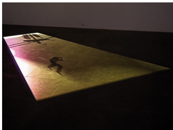
Paul Chan, "First Light", 2005

Peter Weibel, le directeur du ZKM, s'est associé à Boris Groys pour concevoir l'exposition "Medium Religion". Il explique : "Les religions sont passées de la sphère privée des croyances personnelles à la sphère publique de la communication visuelle." Le New-yorkais Paul Chan y expose First Light (2005), à même le sol. On ne perçoit, dans le rectangle de lumière vidéoprojetée, que des ombres nous évoquant l'allégorie de la caverne de Platon. Un poteau électrique, un lampadaire et des fils structurent l'image où une multitude d'oiseaux s'envolent. Que fuient-ils ? Peut-être la déflagration qui fait s'élever silencieusement, comme dans la lenteur d'un ralenti, quelques silhouettes d'objets de notre quotidien se disloquant. On reconnaît les wagons d'un train, des véhicules, un scooter, un vélo, une paire de lunettes ou des téléphones portables. Et, dans le sens inverse, des d'êtres humains qui, quant à eux, n'échappent pas à la pesanteur en traversant l'image furtivement durant leur chute. Et l'on revoit avec effroi les images de ceux qui se précipitaient dans le vide pour échapper aux flammes du 11 septembre.