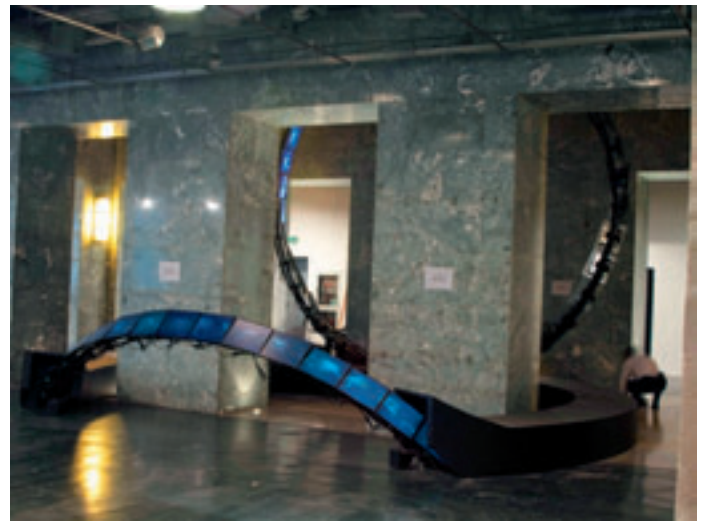
The End Has Non End, installatiOn interactiVe, 2008.