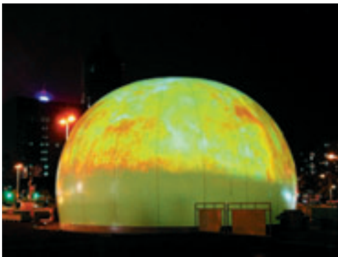
Globe Fire, installatiOn interactiVe, 2007.