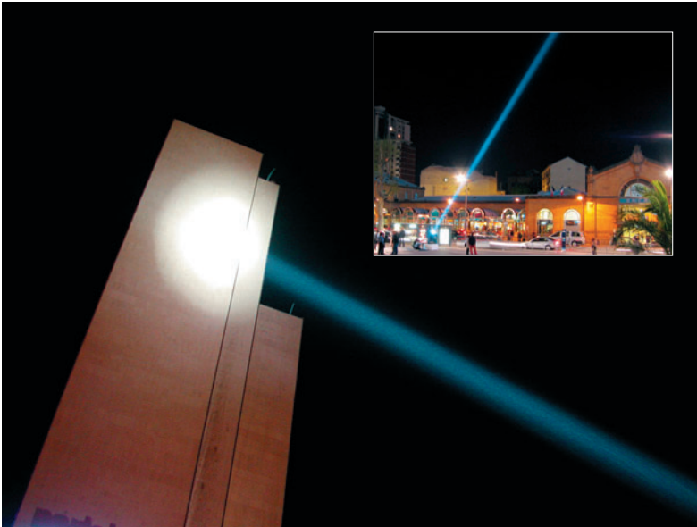
30x30 Poursuite, 2006