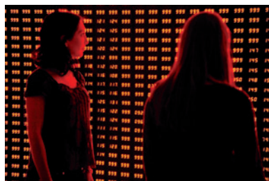
Valéurs croisées, 2008