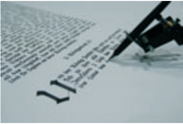
bios [biLe], 2007.