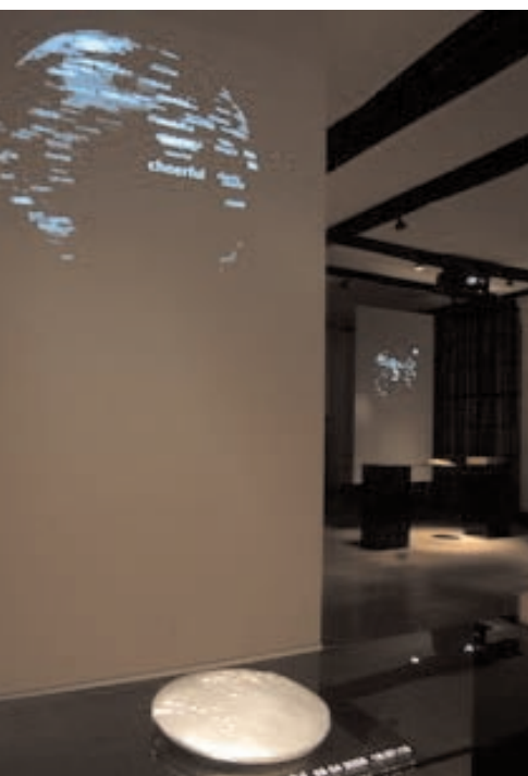
CI-DESSUS : Frozen Feelings Emotional Market (2005), installation multimédia et sculptures. EN HAUT, DE GAUCHE À DROITE : Labylogue (2000), installation 3D interactive en réseau réalisée en collaboration avec Jean-Pierre Balpe et Jean-Baptiste Barrière. So.So.So. (2002), installation de réalité virtuelle en réseau réalisée en collaboration avec Jean-Baptiste Barrière.