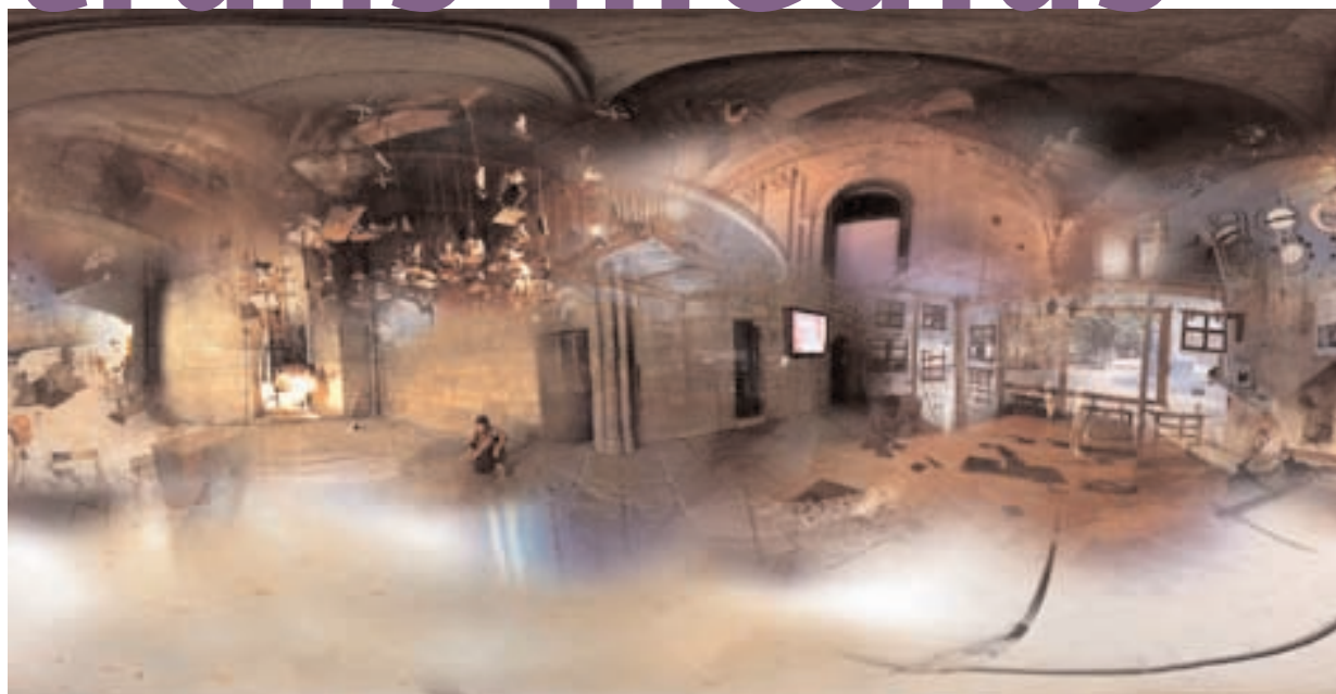
Art Impact (2000), installation de réalité virtuelle en réseau réalisée en collaboration avec Jean-Baptiste Barrière.

Né en 1957, Maurice Benayoun est agrégé d'arts plastiques et enseigne, depuis 1984, à l'université Paris I. Cofondateur, en 1987, de la société ZA production spécialisée dans les nouveaux médias, il est lauréat de la Villa Médicis hors les murs en 1993 pour son projet "AME" (Après Musée Explorable). Maurice Benayoun est aussi directeur artistique du CITU (Création interactive transdisciplinaire universitaire), dont il est également le cofondateur.