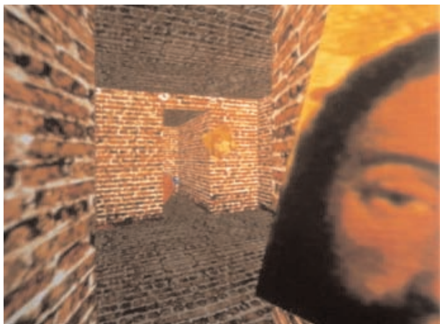
Dieu est-il plat ? (1994), installation 3D interactive de la série Les grandes questions .

Il ne s'agissait pas uniquement de la guerre en ex-Yougoslavie, mais aussi de la Seconde Guerre mondiale puisque Linz est également la ville où Adolf Hitler a passé son enfance, à l'école avec Wittgenstein. Ce n'était donc pas complètement innocent. Quant au Cave, il permet de placer plusieurs individus dans une situation totalement immersive, immergés dans la représentation. Des individus à qui je propose une expérience collective : devenir des touristes durant Un safari photo au pays de la guerre . La réalité virtuelle permet de créer des situations qui nous interrogent sur des choses aussi fortes et triviales que la guerre. World Skin, un safari photo au pays de la guerre , à cette époque, était au plus proche de ce que j'espérais faire dans mon travail. Depuis, j'ai l'impression d'être allé ailleurs, pas forcément plus loin, ailleurs, dans la continuité de ce même travail.